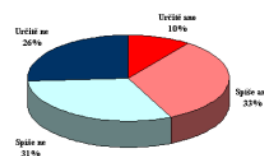
„Máte důvěru v prezidenta republiky Miloše Zemana?“ (%)