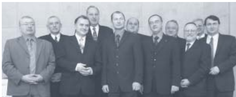
Hejtmani českých a moravských krajů

Názory se samozřejmě různí, dovolím si nicméně přiklonit se k těm, kteří mají za to, že vytvoření krajské správy ve stávající