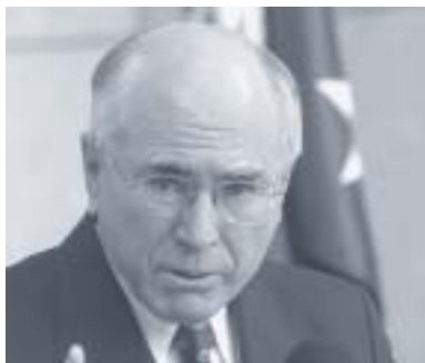
Australský premiér John Howard

Austrálie prožívá šest týdnů napjaté volební kampaně, kterou dokresluje očekávaná těsná většina pro jeden z táborů a stále se přelévající výsledky výzkumů volebních preferencí. Poslední výzkum volebních preferencí, který provedla nejdůvěryhodnější z výzkumných institucí, přinesl těsný výsledek. Pro vládní blok by nyní hlasovalo 48 procent voličů, pro labouristickou opozici 52 procent voličů.