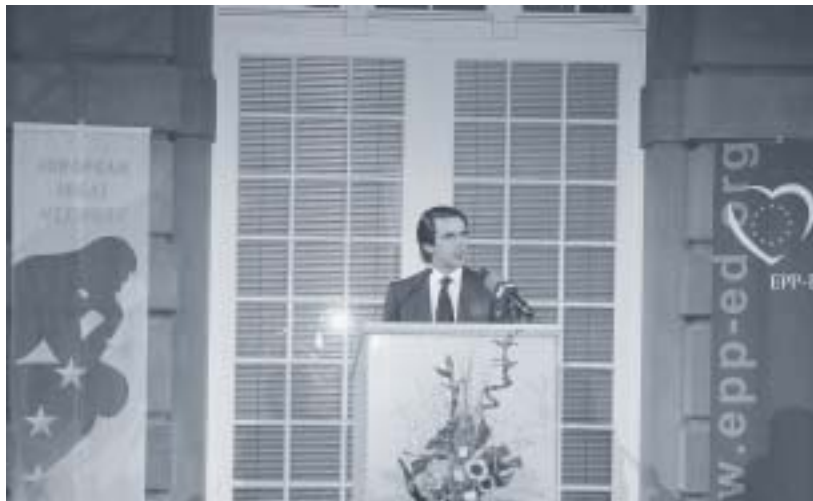
European Ideas Network – Summer University, José María Aznar, premiér Španělska