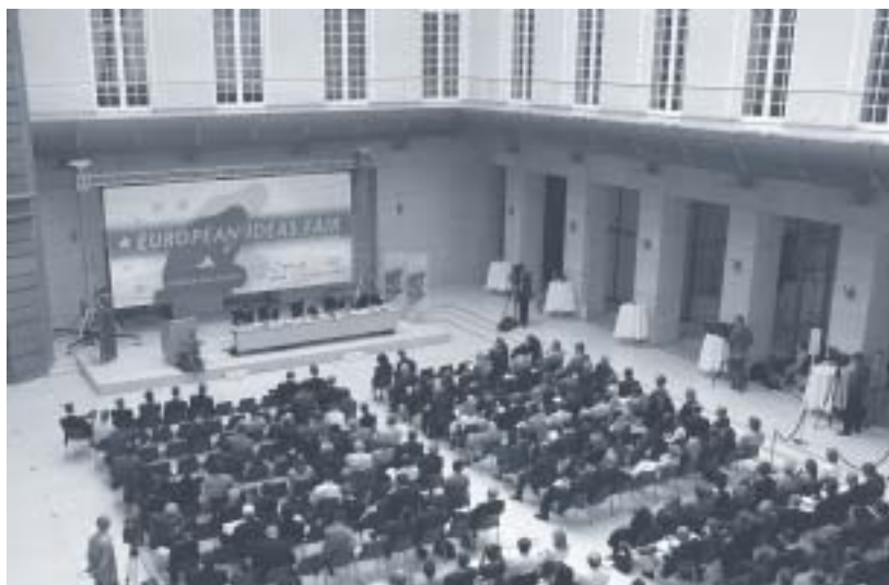
Účastníci EIN v prostorách Deutsche Bank, Berlín

všech zúčastněných institucí, kteří seznámili ostatní účastníky s činností jejich organizací. Účastníky tohoto setkání byli zástupci think tanků z Itálie, České republiky, Rakouska, Velké Británie, Španělska, Francie, Maďarska, Nizozemska, Německa a Litvy. CEVRO zastupovala autorka tohoto textu.