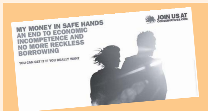
Příklady „zelené“ kampaně britských konzervativců: Moje peníze v bezpečných rukou. Konec ekonomické nekompetenci a dalšímu nezodpovědnému zadlužování.

Britská konzervativní strana má dlouholetou a koherentní politiku ochrany životního prostředí, jak je možno se přesvědčit z politických dokumentů nebo volebních programů. Její nedávný předseda, Michael Howard, zdůrazňoval ve svých projevech povinnost rozumně chránit přírodu a přírodní suroviny před přílišným rozvojem a využíváním. Konzervativní strana již