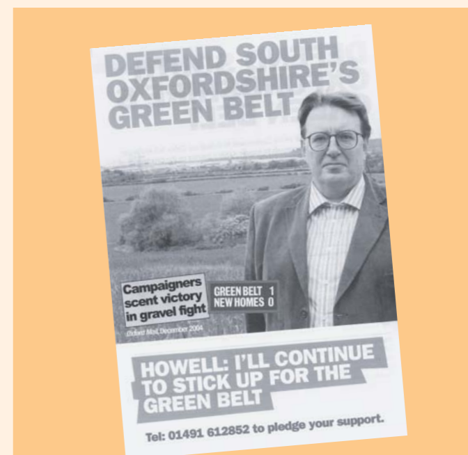
Příklady „zelené“ kampaně britských konzervativců: Zachraňte oxfordskou zeleň. Howell: Budu se dále zastávat zeleně.

Konzervativci také deklarovali, že je třeba chránit prostředí k životu pro další generace. K tomu je nutno doplnit, že jde o prostředí pro nás stejně jako pro další generaci – egoisticky je nutno hlídat stav prostředí pro nás, ne pro děti roku 2050.