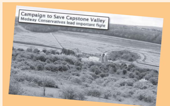
Příklady „zelené“ kampaně britských konzervativců: Kampaň za záchranu Capstonského údolí. Medwayští konzervativci vedou důležitý boj.

Tato vláda vzala vážně hrozbu globálního oteplování a na Summitu Země v Rio de Janeiru unilaterálně vyhlásila v roce 1992 stabilizační cíl emisí skleníkových plynů . Vedle využívání obnovitelných zdrojů zdůrazňovala nutnost zvyšování bezpečnosti jaderných elektráren jako důležitého zdroje elektrické energie, který neemituje škodlivý oxid uhličitý . Sám Howard, který byl v minulosti ministrem životního prostředí britské konzervativní vlády, přesvědčoval amerického prezidenta Bushe staršího, aby klimatickou úmluvu OSN podepsal.